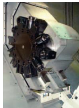
C+Y osa ( opce)