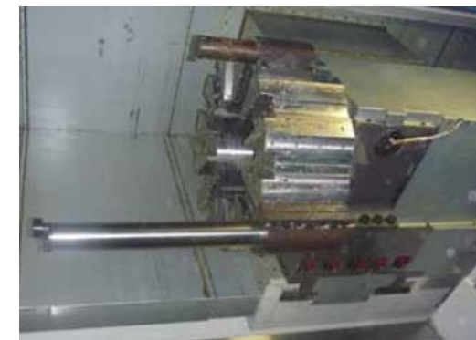
Vyvtávání do hloubky 1000 mm