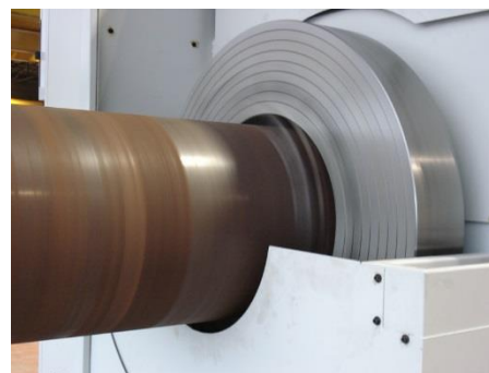
Zadní sklíčidlo ( opce)