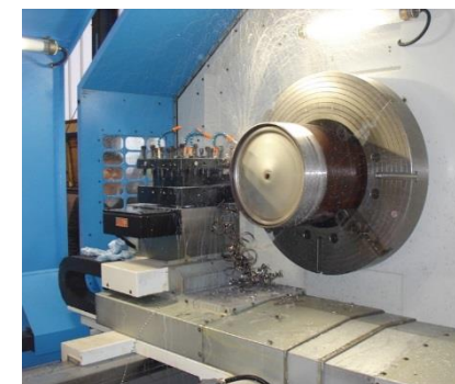
Obrábění velkých trubek